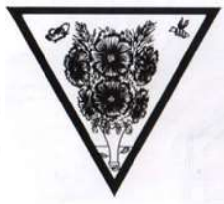
Второй этап «Композиция». Темы заданий: музыка, морское дно, растение