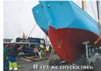
И тут же спускаешь