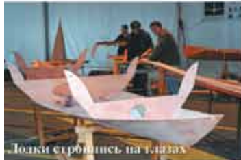
Толки строишь на глазах