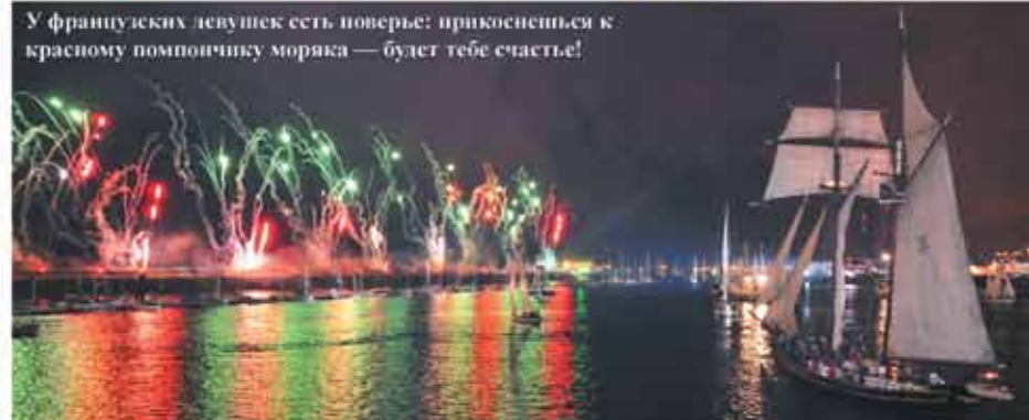
У французских девушек есть поверье: прикоснешься к красному помпончику моряка — будет тебе счастье!