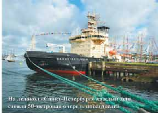
На ледокол «Санкт-Петербург» каждый день стояла 50-метровая очередь посетителей