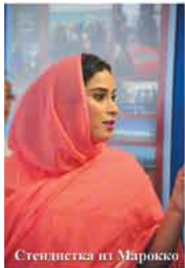
Стелдистка из Марокко