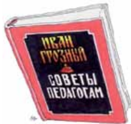
Рис. Серик КУЛЬМИШКЕНОВ

коврик! Так что ему ещё не раз придётся пожать о случившемся!