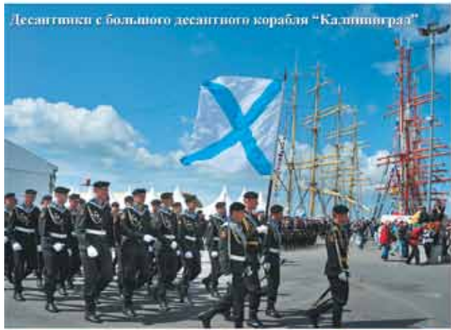
Десантиски с большого десантного корабля «Кашинград»