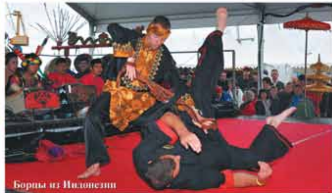
Борьба из Индонезии