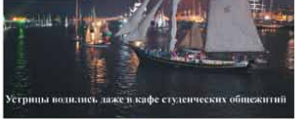
Устрицы водились даже в кафе студенческих общежитий