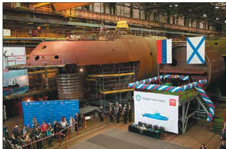
Церемония закладки подводной лодки «Старый Оскол» на ОАО «Адмиралтейские верфи».

«Рассматриваем все проекты, не только «Ладу». Будем модернизировать подводные лодки — ставить самое современное оружие», — говорит главком ВМФ РФ Виктор Чирков.