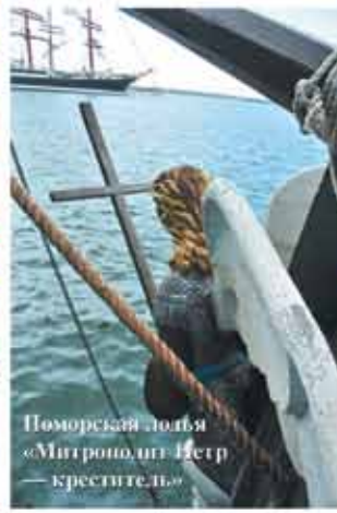
Поморская дубля «Митрофан Петр-креститель»