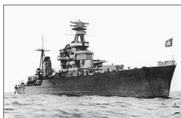
Крейсер «Киров». 1941 год

Напротив здания Корабелки на Лоцманской установлен якорь. Для кого-то это исключительно морская символика. На самом деле, это – реальный кормовой стоп-анкер легендарного крейсера «Киров», который был флагманом в знаменитом «Таллинском переходе» эскадры Балтийского флота в Ленинград. Балтийский флот в конце сентября 1941 года от-