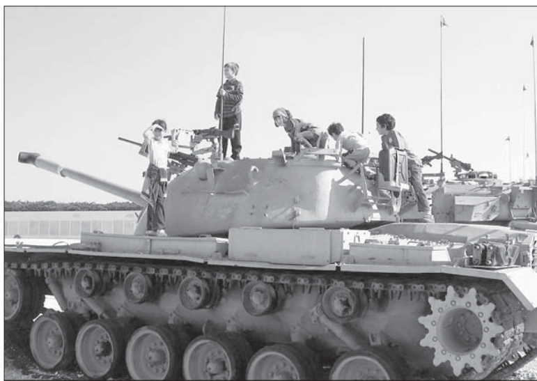
Давайте отдадим всё оружие детям, и пусть они его доламывают!