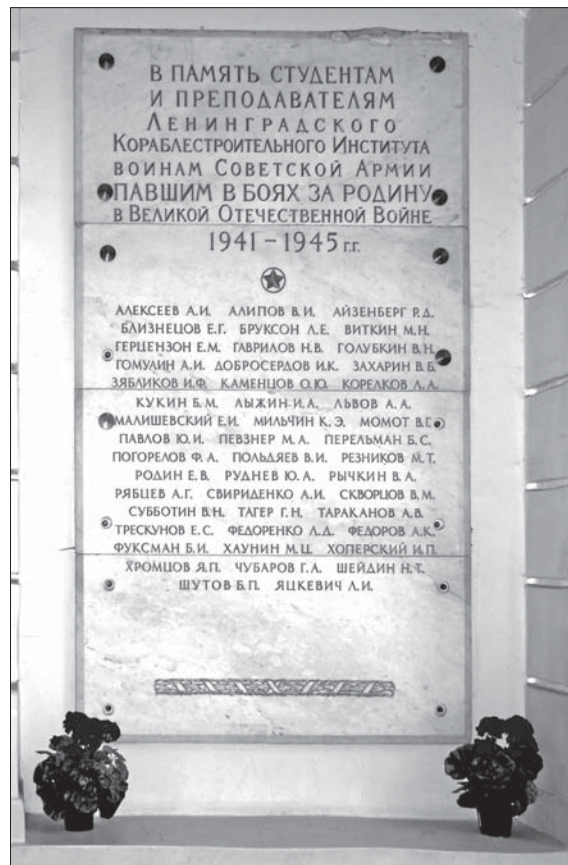
На мемориальных досках в фойе главного корпуса Корабелки – имена студентов и сотрудников, отдавших жизнь за Родину на полях сражений Великой Отечественной войны. Все они – тоже наши Герои!