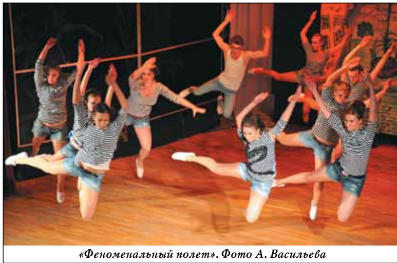
«Феноменальный полет».

Эта информация будет полезна тем, кто еще не продемонстрировал свой вокальный талант, хочет научиться петь и проявить себя на этом поприще. Совсем скоро начнутся занятия с новыми педагогами, которые будут рады всем