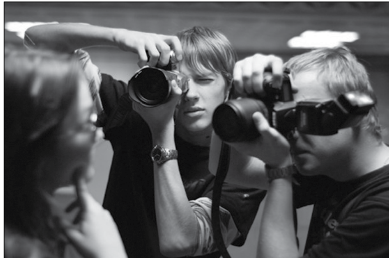
Фотоклуб «Без рамок». Эстафета фотомастерства в Корабелке — продолжается!

Новый выпуск ожидается в «Школе ведущих телевизионных и шоу программ». Уже к фестивалю «Весна на Лотманской» мы увидим свежие «говорящие» лица.