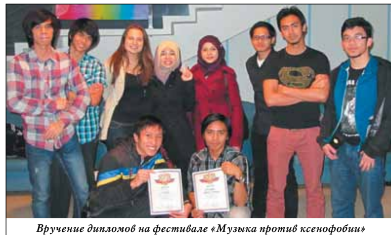
Вручение дипломов на фестивале «Музыка против ксенофобии»

В этом году планируется поездка в Томск, где совместно с иностранными студентами со всей России наши ребята смогут показать себя во всей красе и постоять за честь нашего университе-