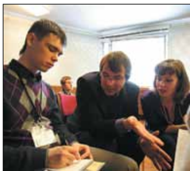
Заседание секции Вычислительной техники на конференции СНОО ГМТУ.

дой экологической безопасности на море, и главная цель, преследуемая на них, — это использование экологически чистых видов двигателей, которые не выделяют загрязняющие вещества в окружающую среду. По окончании работ должно получиться