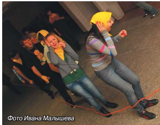
Фото Ивана Малышева