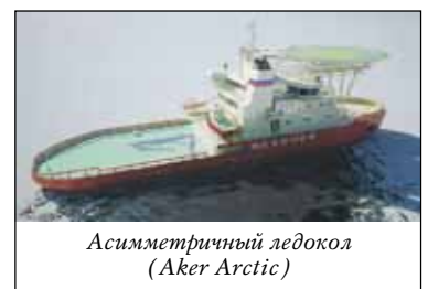
Асимметричный ледокол (Aker Arctic)

12 декабря состоялся совместный российско-финский семинар, на котором выступили преподаватели и студенты университета Аальто и СПбГМТУ. С приветствиями от имени администрации вузов выступили пер-