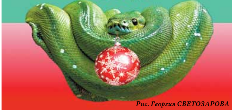
Рис. Георгия СВЕТОЗАРОВА