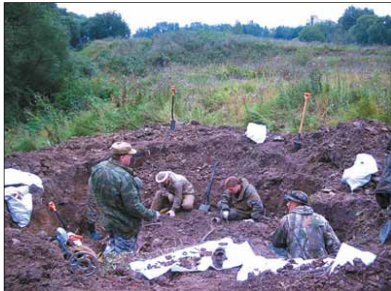
Процесс эксгумации останков солдат из воронки. На заднем плане виден дом, стоящий на Авангардной улице