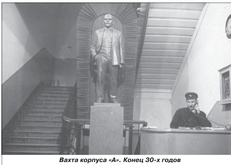
Вахта корпуса «А». Конец 30-х годов