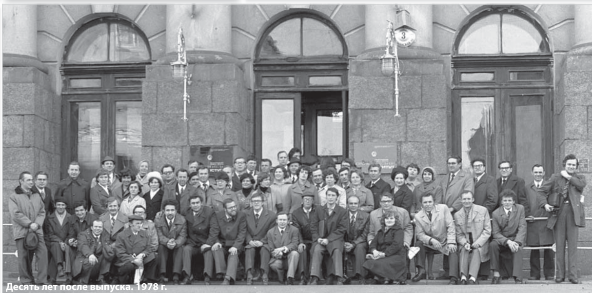
Десять лет после выпуска. 1978 г.