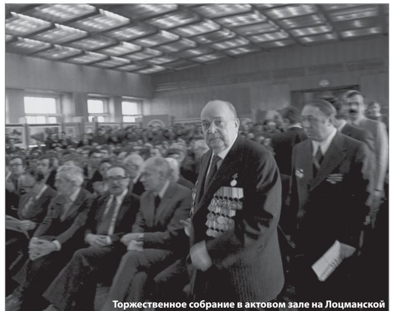
Торжественное собрание в актовом зале на Лоцманской