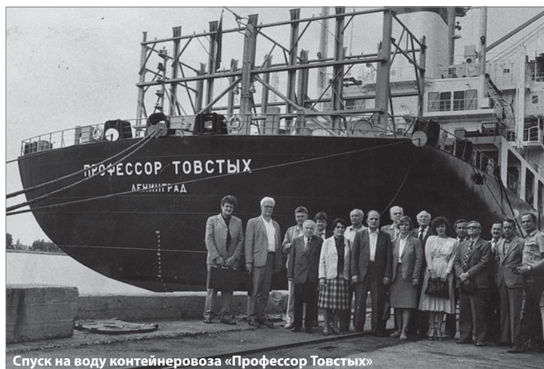
Спуск на воду контейнеровоза «Профессор Товстых»