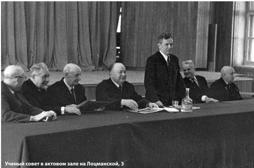
Ученый совет в актовом зале на Лощманской, 3