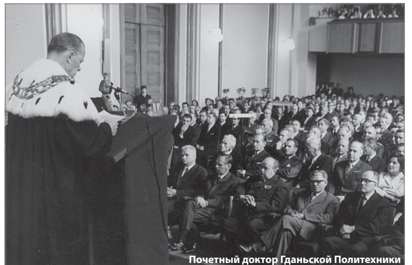
Почетный доктор Гданьской Политехники