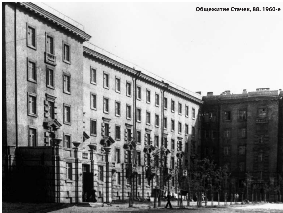
Общежитие Стачек, 88. 1960-е